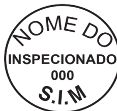
Modelo 3: 4cm de diâmetro